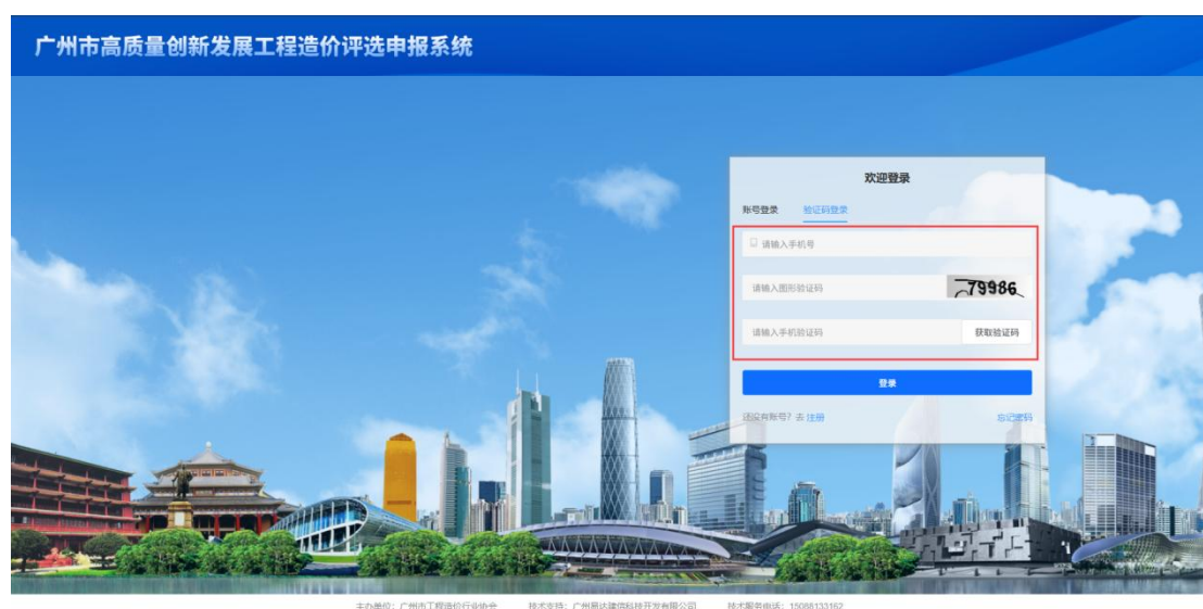
(图5 系统验证码登录)

在“企业基本情况”界面填写申报企业的基本情况信息，所填内容应真实、有效、无误，并慎重勾选企业申报的奖项类别。详细查看和勾选申报承诺后，点击“下一步”。