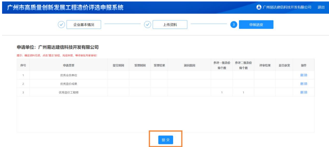
(图 10 申报材料提交)

在“申报进度”界面，点击“提交”按钮，完成本次申报，申报材料推送至市协会审查评审。